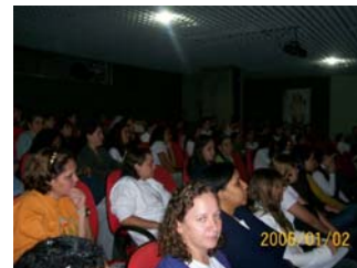
Alunos, no auditório