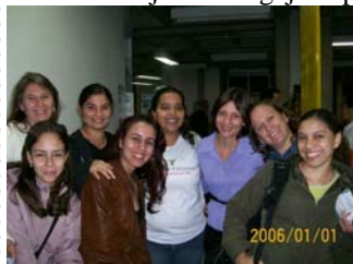
Alunos de enfermagem

A comissão já está engajada para o próximo ano. Até lá!!!