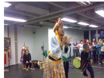
Peça "Diva, a Divinha"