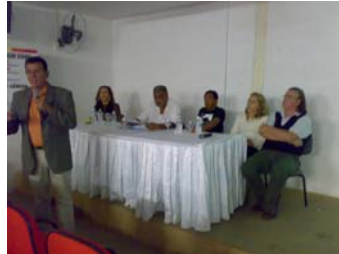
Mesa sobre "diversidade"