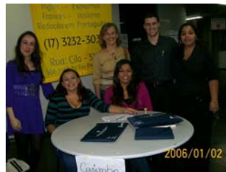
Mesa de recepção